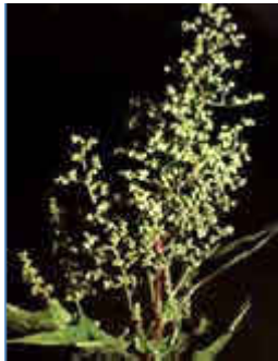
Figuur 2. Bloeiend gras, veroorzaker van hooikoorts.